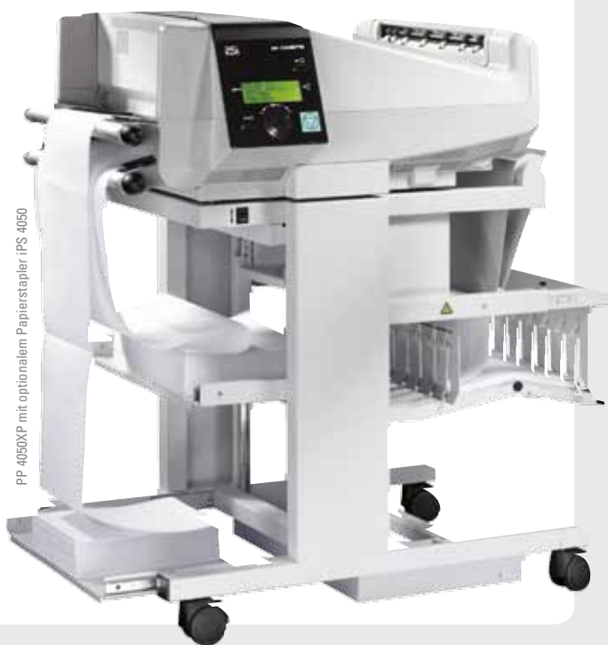
PP 4050XP mit optionalem Papierstapler iPS 4050